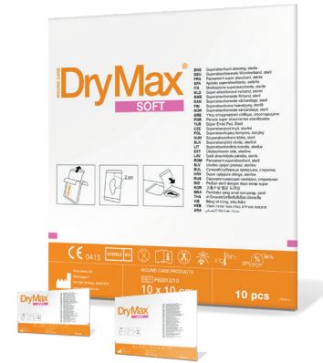
Nieuwe verpakking en nieuwe naam