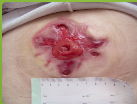
Aanvang - januari

Mevrouw met een colostoma woonachtig in Duitsland en diverse grote verwondingen rondom de stoma waardoor het plakken van een stomazakje ernstig werd belemerd. Met behulp van de algiinaat huidplaat van LaproCare ® Sensitive in combinatie met algiinaat wondvullende verbanden is de wond hersteld. Vanwege de zeer lastige locatie, vorm en grootte van de wond heeft het herstel uiteindelijk 10 maanden geduurd. Mevrouw blijft de Sensitive stomazakjes voortaan gebruiken en heeft zo haar kwaliteit van leven weer maximaal terug gekregen.