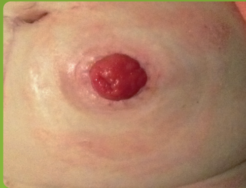
Resultaat - 16 oktober (na 8 dagen)

Mevrouw met een colostoma in het zuiden van Nederland met langdurige huidproblemen en een intensieve begeleiding door het ziekenhuis, de medisch speciaalzaak en de thuiszorg. Diverse huidplaten zijn geprobeerd en uiteindelijk is er gestart met LaproCare ® Sensitive. Resultaat na slechts 8 (!) dagen: roodheid en irritatie rondom de stoma is vrijwel verdwenen en de huid is weer tot rust gekomen. De zorgtijd, het materiaalgebruik en daarmee de zorgkosten zijn sterk gedaald en de kwaliteit van leven van deze mevrouw is aanzienlijk toegenomen.